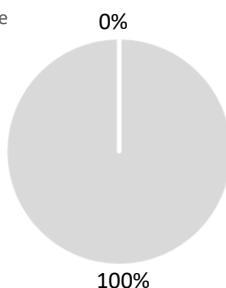
2. Allineamento degli investimenti alla tassonomia escluse le obbligazioni sovrane*